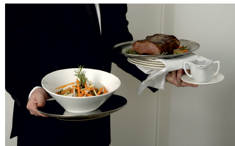
d. .... .....